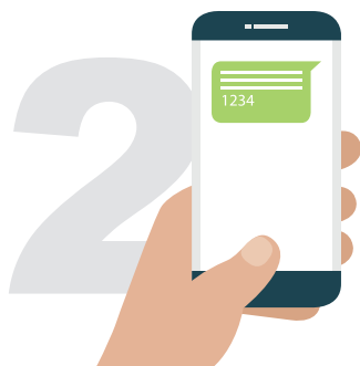
Réception du SMS envoyé par Mutual IT permettant la double authentification pour plus de sécurité