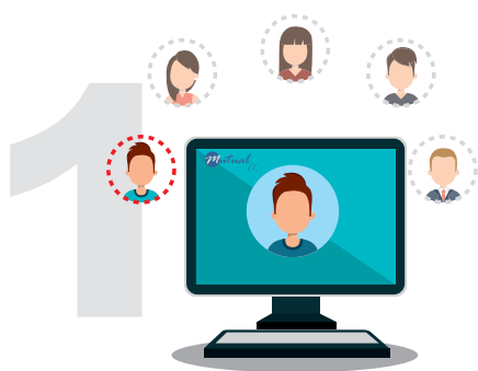
Connexion sur l'espace adhérent et sélection du bénéficiaire de la téléconsultation